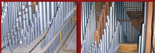
Wnętrze starych organów, wiatrownice poszczególne chóry głosów

Po raz pierwszy w naszej świątyni organy zabrzmiały w 1956r, wybudowane przez firmę Władysława Karczmarka z Wroniek. Instrument posiadał 14 głosów i trakturę w pełni pneumatyczną, został skompletowany z części różnych organów. Wiatrownica I manualu i pedału wraz z piszczałkami pochodziła z organów p.Voelknera, poprzednio zamontowanych w szkole w Wolsztynie. Wiatrownica