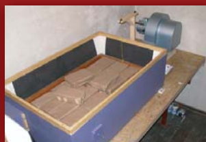
Michy: z lewej pomocnicze, prawej główne z widoczną w tyle dmuchawą

Organy posiadają 23 głosy w tym 4 głosy językowe. Kontuar (stół gry) wyposażony jest w 2