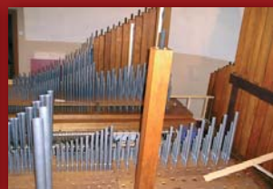
Wiatrownice nowych organów, pierwsze wstawione chóry głosów

Od września postępowaly prace przy budowie naszego instrumentu i zostały zakończone w marcu bieżącego roku.