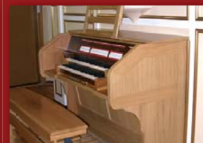
Z lewej największe piszczałki (głos językowy fagot), z prawej nowy kontuar