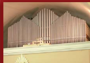
Nowy i stary prospekt organów

Wiatrownice i piszczałki zostały wykonane z drewna egzotycznego, dąglezji oraz sosny, metalowe ze stopu cyny z ołowiem. Instrument posiada 3 miechy, dmuchawę cichobieżną firmy Laukhuff , aparat tremolo powodujący wibrację dźwięku.